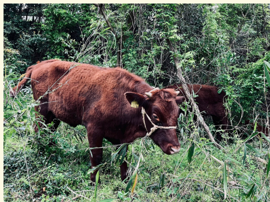
オアシスファームの渥美半島短角牛も堪能！

生産者の情熱と、料理人の技。東三河の食・農の未来を創造するイベントを、ぜひ心ゆくまでお楽しみください。